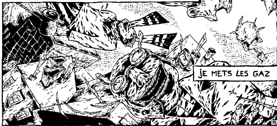
JE METS LES GAZ