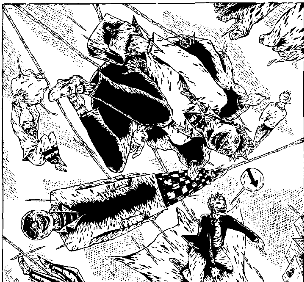
MA RAIE MANTA DÉMARRE AU QUART DE TOUR